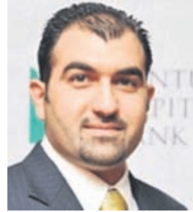
● هشام أبو الفتح

الشهر الفضيل مع المذيع التلفزيوني الرياضي السابق هشام أبو الفتح والذي اشتهر بشكل كبير للغاية في نهاية التسعينات بالذات ببرنامجه (ما يطلبه الرياضيون) الذي حقق شهرة واسعة في البحرين و خارجها، وقال أبو الفتح إنه كان سعيداً للغاية بتقديم ذلك البرنامج الذي حقق نجاحاً رائعاً حينها، وإلى الآن لدى العديد من المطالبات بإعادة عرض البرنامج مرة أخرى، ولكن هذا الأمر أصبح صعباً للغاية الآن، ففترة عرض البرنامج كانت في نهاية التسعينات، وتلك الأيام لم تكن هناك بطولات حصرية على قنوات معينة، وبالتالي أصبحت مكتبة التلفزيون خالية من