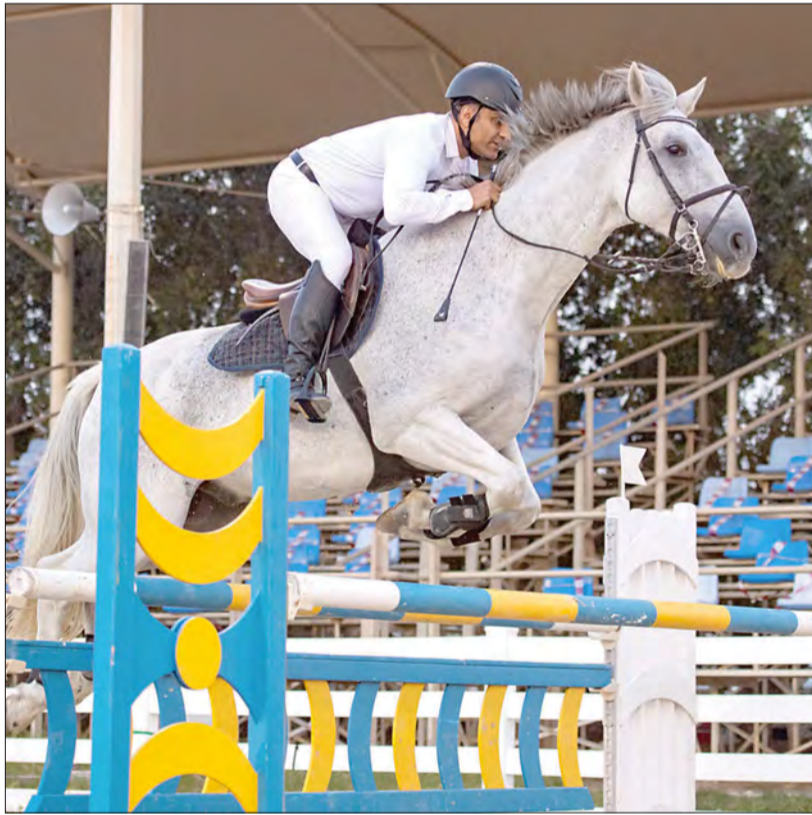
من منافسات قفز الحواجز

بما شهده الميدان من مستويات فية عالية جدًا، وهذا يترجم عمل منظومة متكاملة والتي تشمل الفرسان والمدربين وكل من له علاقة، جهد كبير بذله الجميع في الفترة الماضية ألقى بظلاله على مستوى المنافسات وبناءً على هذه النتائج والمستويات ووجود فرسان قادرين على تجاوز هذه الارتفاعات رفعت اللجنة المنظمة ارتفاعات الحواجز حتى 145 سم والتي ساهمت وبشكل كبير في رفع مستوى وحدة التنافس، والله الحمد ها نحن اليوم ندخل آخر جولات الموسم مكملين جميع البطولات بنجاح كامل».