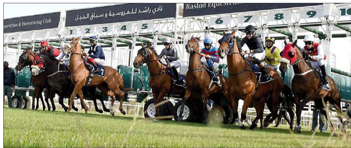
لقطة من السباقات الأسبوعية للخيل

سوت - يوان برنس - الطور - بارني بير - ديز دستني - إكو سيرست - فارس السلام - هي دو - كيان - مبتدا - نايت واربور - أوغن ستر - روزفلتس قريت - ويست سوفوك - عسل - بي أوف وسبرس - متوكلة - رشعيا. الشوط السادس يقام على كأس بنك البحرين والكويت للجياد سباق التوازن «مستورد» مسافة 1200 متر مستورد والجائزة 2500 دينار وبمشاركة 11 جواداً هي «الأبرار - توليب فيفر - هميش ماكبت - دون أرمادو - كلاري بلو - غارسمان - أوراقي - أليكو - براق ستينيس - داركاش - ديلجنت ديب».