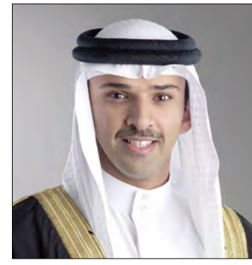
الشيخ علي بن خليفة

قدمت شركة الخليج لصناعة البتروكيماويات «جيبك» رعايتها لمسابقة كأس جلالة الملك المفدى ومسابقة دوري ناصر بن حمد الممتاز لكرة القدم للموسم الرياضي 2020-2021. وفي تصريح له بهذه المناسبة، ثمن رئيس مجلس إدارة الاتحاد البحريني لكرة القدم الشيخ علي بن خليفة بن أحمد آل خليفة دعم شركة «جيبك» للمسابقتين، مؤكداً أهمية الدعم الذي تقدمه الشركة بصورة مستمرة لإنجاح هاتين المنافستين اللتين يترقبهما الجمهور الرياضي في المملكة، ومشيراً إلى أن هذه الرعاية تعكس حرص «جيبك» على تطبيق الشراكة المجتمعية بين القطاع الخاص وقطاع كرة القدم البحرينية.