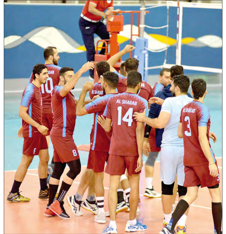
طائرة الشباب خلال منافسات الموسم الرياضي