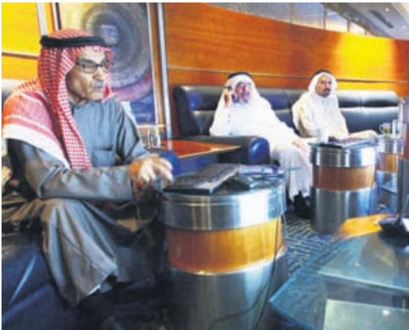
● متداولون سعوديون يراقبون البورصة

الرياض-د ب أ: كشفت بيانات سعودية نشرت امس الخميس أن القيمة السوقية للأسهم المصدرة بالسوق المالية السعودية (تداول) بلغت بنهاية شهر أغسطس الماضي حوالي 1204 مليار ريال أي ما يعادل 321 مليار دولار أمريكي، بانخفاض بلغ 32.2% عن الشهر السابق.