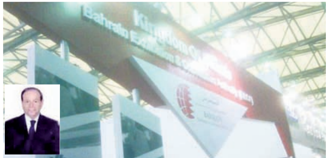
● جناح البحرين في معرض إسبانيا الدولي وفي الاطار وزير الصناعة والتجارة

وهيمن هاجس الترقب لمعرفة مسار السوق والأسعار في ظل وجود تحليلات وتكهات بأن الأسعار يمكن أن تنحدر بنسب أكبر خلال الأشهر القليلة المقبلة.