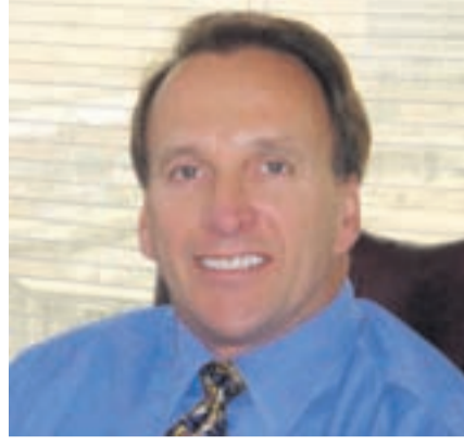
● فل غاندير

كشف تقرير لشركة إرنست ويونغ حول نشاط صفقات الاندماج والاستحواذ في منطقة الشرق الأوسط وشمال إفريقيا، أن القيمة الإجمالية لصفقات الاندماج والاستحواذ المعلنة في المنطقة هبطت في النصف الأول من العام الجاري 2010 بنحو 15٪، لتسجل 18.5 مليار دولار أمريكي مقارنة مع 21.7 مليار دولار في النصف الأول من عام 2009 المنصرم.