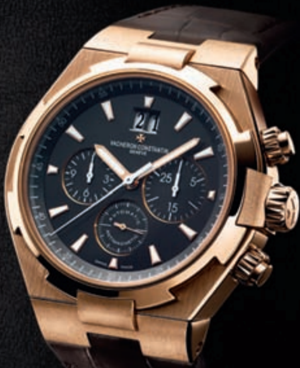
أوفير سين كرونوغراف

VACHERON CONSTANTIN Manufacture Horlogère, Genève, depuis 1755.