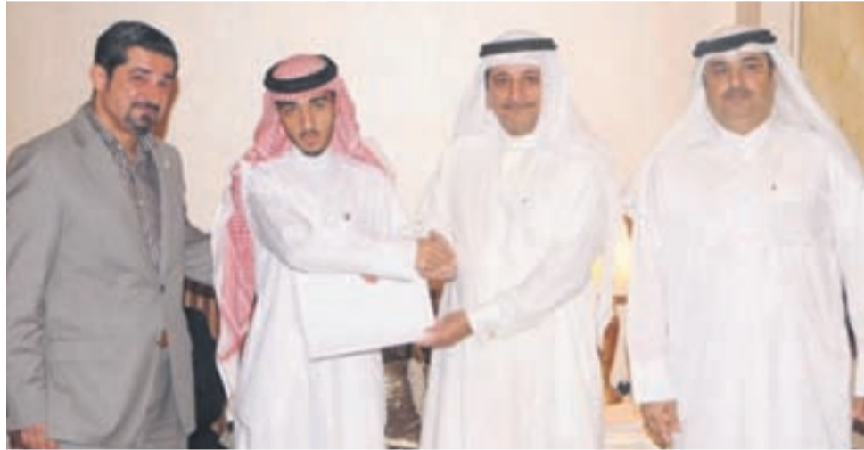
● فخرو أثناء حفل التكريم

فريق العمل الذي بفضل جهوده حقق الملتقى النجاح المنشود.