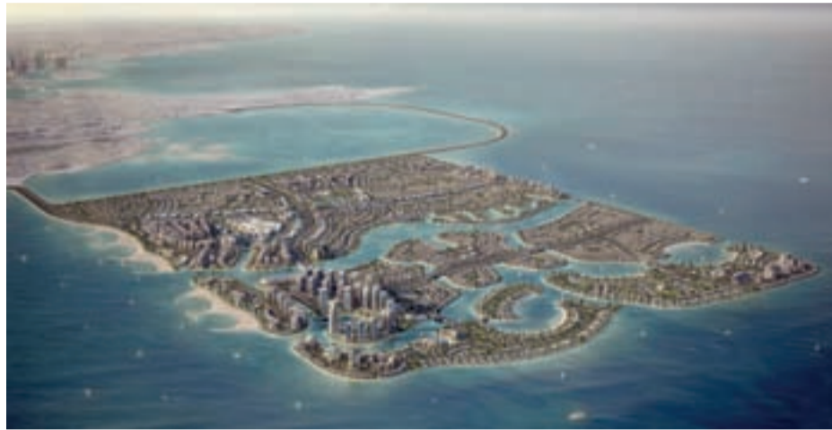
● المخطط الرئيسي لمشروع ديار المحرق

الجدير بالذكر، إن مشروع ديار المحرق تم إطلاقه نهاية يونيو 2008، ويُعد أحد أكبر المشاريع العمرانية الشاملة التي ينفذها القطاع الخاص في البحرين وتبلغ مساحة المدينة 12 كيلومتراً مربعاً، فيما تبلغ الكلفة الإجمالية للبنية التحتية للمشروع 1.2 مليار دينار بحريني (3.2 مليار دولار)، وتعود ملكية المشروع إلى بيت التمويل الكويتي الذي يمتلك 50% من المشروع، بالإضافة لشراكة عدد من المستثمرين الخليجيين، ويخصص المشروع العمراني موارد كبيرة لتطوير مبادرة بيئية شاملة تنطوي على مجموعة من الاستراتيجيات لدعم الحياة البحرية ومحميات الأسماك والصيدان المحترفين البحرينيين.