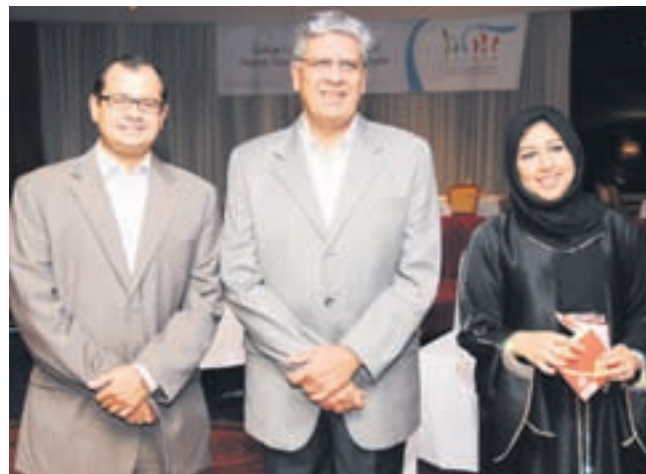
● جانب من بقعة «سكنا»