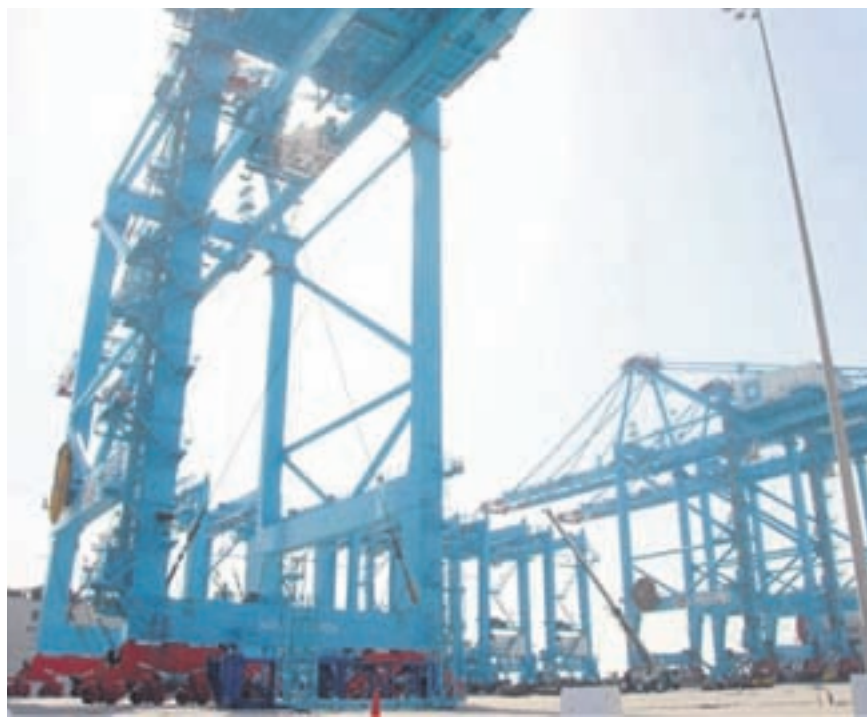
● ميناء خليفة

كما أعرب رئيس الغرفة عن بالغ اعتزازه لسرعة تجاوب المؤسسة العامة للموانئ البحرية وإيجادها الحل المناسب لهذا الموضوع، وقال إن هذا القرار سيكون له آثار طيبة على أوضاع مستخدمي فرصة المحرق السابقين، وعلى الحركة التجارية ومنع أية ارتباكات قد تؤثر عليها وعلى النشاط التجاري بصفة عامة جراء غلق الفرصة.