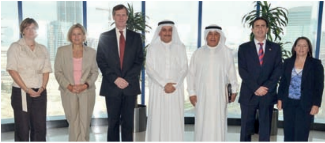
● الجانبان يتطلعان لتنمية العلاقات الاقتصادية التجارية بين البلدين

وتنمية العلاقات الاقتصادية والتجارية بين أصحاب الأعمال في البلدين، وأكد على أهمية تكثيف التعاون بين الجانبين من خلال إقامة الفعاليات المشتركة التي تستهدف تقوية وتنمية وتطوير علاقات التعاون التجاري والاقتصادي بين مملكة البحرين وبريطانيا، ونوه بدور الغرفة في تطوير الاستثمار المشترك وتذليل المعوقات والصعوبات التي تواجه المستثمرين.