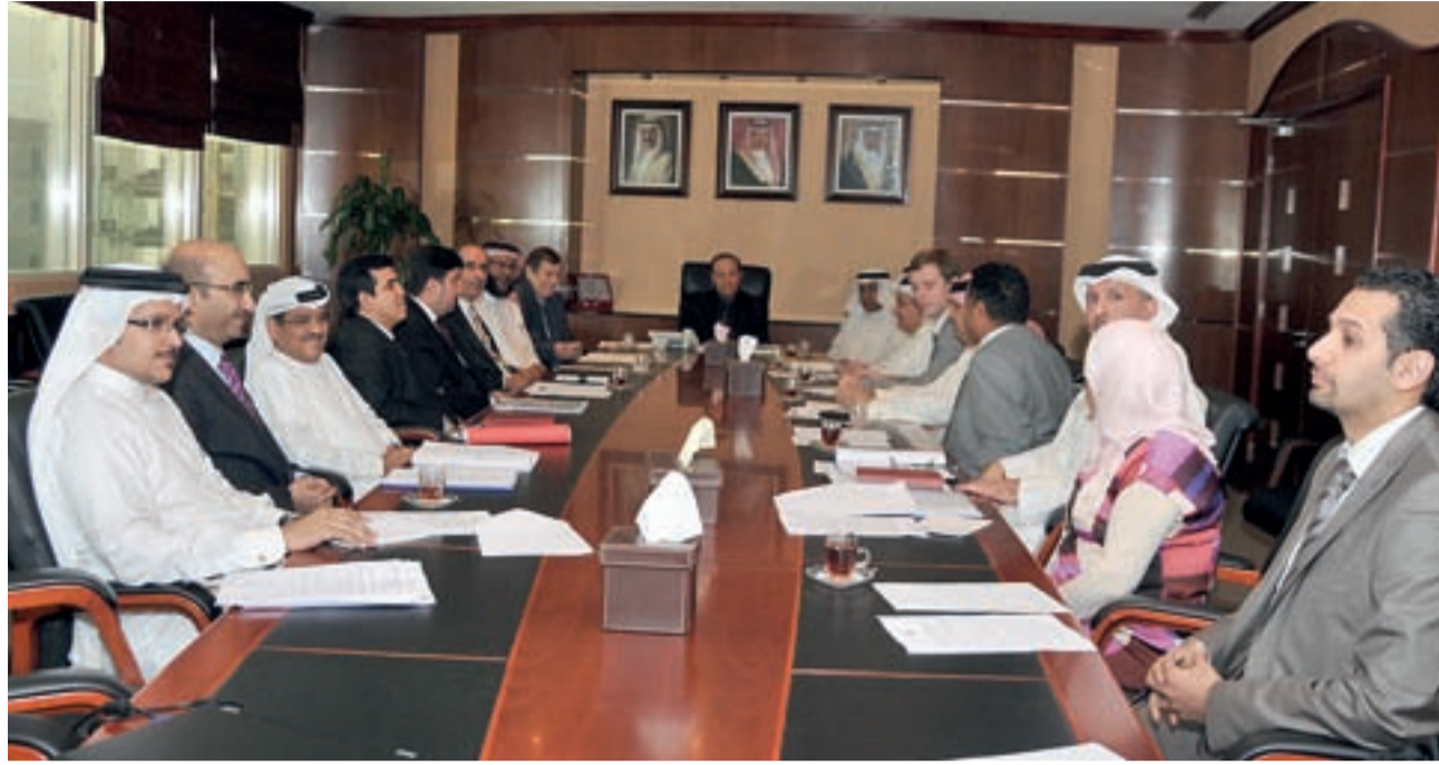
● الوزير فخرو مترأساً الاجتماع مع ممثلي المؤسسات الحكومية والشركات الخاصة

أكد وزير الصناعة والتجارة الدكتور حسن عبدالله فخرو حرص ومتابعة الحكومة ووزارة الصناعة والتجارة لكل المشاريع والمنجزات الاقتصادية التي تتم بين مملكة البحرين وجمهورية روسيا الاتحادية، التي أسفرت عن الزيارة الكريمة لصاحب الجلالة الملك حمد بن عيسى آل خليفة. جاء ذلك خلال الاجتماع الذي ترأسه الوزير بمكتبه صباح أمس والذي يعد الرابع من سلسلة الاجتماعات التي عقدت لمتابعة المشاريع التي تمخضت عنها الزيارة الكريمة التي قام بها صاحب الجلالة الملك المعظم إلى روسيا في شهر ديسمبر من عام 2008 بمشاركة وفداً اقتصادياً عالي المستوى، واستعرض الاجتماع الذي حضره السفير الروسي بمملكة البحرين فيكتور سميرنوف وعدد كبير من ممثلي المؤسسات الحكومية والشركات الخاصة ذات العلاقة بالمشاريع والاتفاقيات المشتركة مع الجانب الروسي.