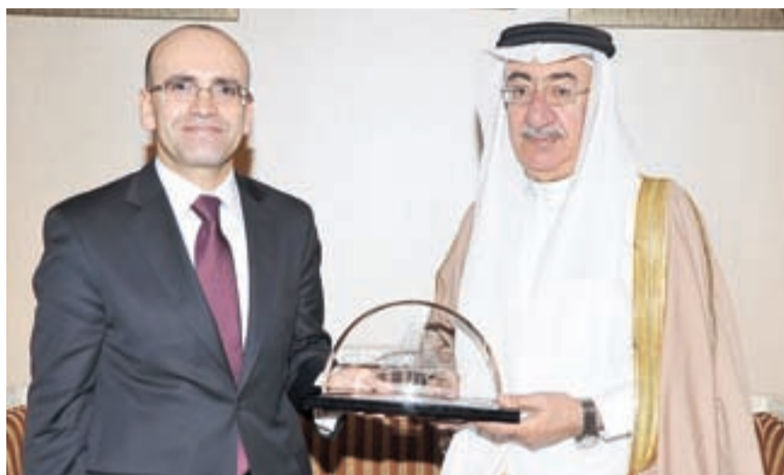
● زينل يهدي الوزير التركي درعاً تذكارية

وأكد على أهمية التوصل الى توقيع اتفاقية التجارة الحرة في السلع والخدمات بين تركيا ودول الخليج العربية لكي تتحقق الطموحات والمصالح المشتركة لجميع الأطراف. واستعرض جانب الغرفة خلال اللقاء مناخ الاستثمار في مملكة البحرين والإمكانات الاقتصادية المتاحة.