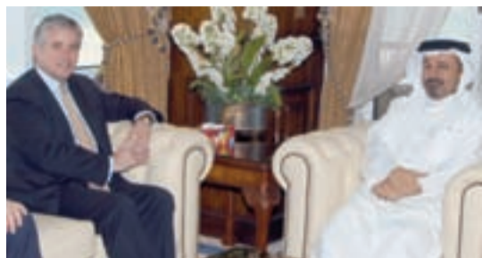
● وزير المالية خلال لقائه عمدة لندن

مؤشر البحرين العام مؤشر داو جونز 1,506.33 126.31 الارتفاع السابق 1,503.77 الانخفاض السابق 126.05