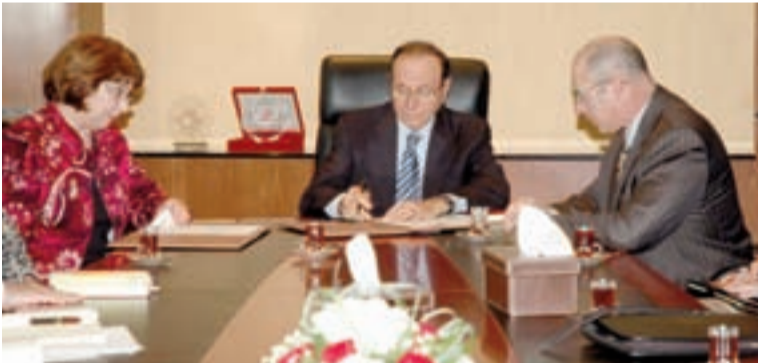
● وزير الصناعة يوقع مذكرة التفاهم

وُقعت يوم الخميس، 18 فبراير 2010 مذكرة تفاهم بين وزارة الصناعة والتجارة ومؤسسة إدارة الأعمال الصغيرة الأمريكية، حول التعاون والتنسيق المشترك فيما يتعلق بدعم المؤسسات الصغيرة.