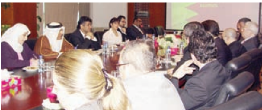
● جانب من اجتماع مجلس التنمية والوفد التركي

حضر اللقاء الدكتور إبراهيم عبدالله سفير مملكة البحرين لدى تركيا وعدد من المسؤولين بمجلس التنمية الاقتصادية.