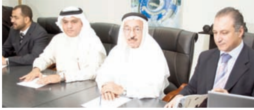
● جانب من المؤتمر الصحفي

ويهدف المناسبة قال رئيس مجلس الإدارة جواد الحواج: «يعتبر معرض البحرين الدولي للحدائق حدث كبير، يلقي الدعم من جلالة الملك حمد بن عيسى آل خليفة وقرينته صاحبة السمو الملكي وذلك لما يشكل من أهمية للبحرين، وقد بدأنا بتحضيرات للمعرض تتوازي وحجمه