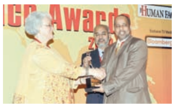
● خلال تسلم الجائزة