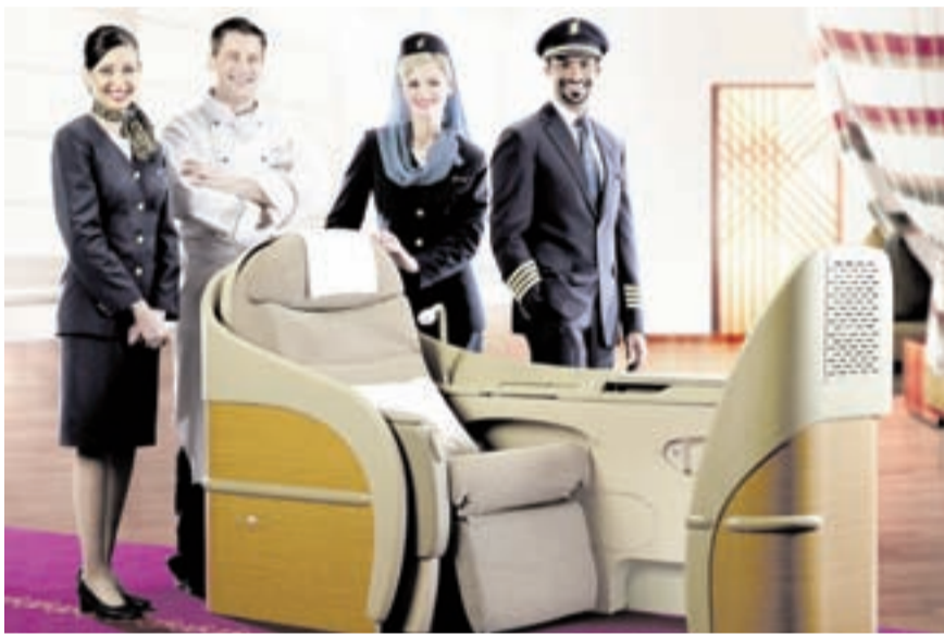
● ميزات إضافية لدرجة الصقر الذهبي

كما سيتم تحديث قاعات طيران الخليج بمطار البحرين الدولي لتشمل «غرفة الطعام» وهو مطعم ذو فكرة مبتكرة، يتيح لمسافري درجة الصقر الذهبي تناول الطعام قبل الإقلاع، ليكون لديهم متسع من الوقت للعمل أو الراحة على متن الطائرة.