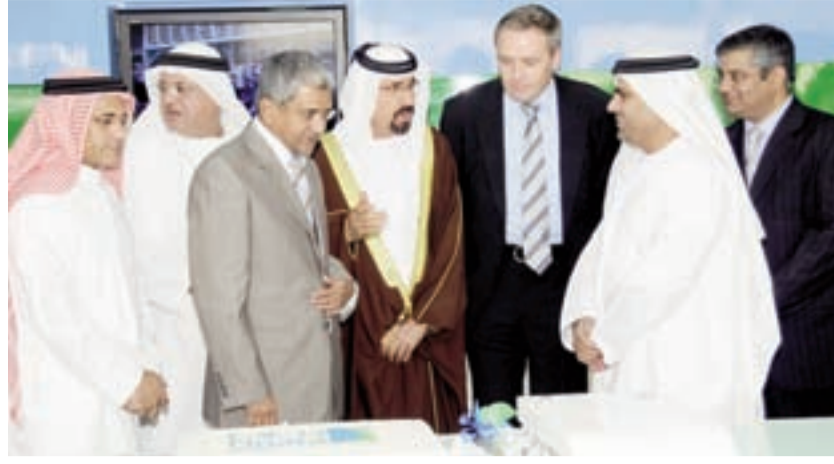
● جانب من الاحتفال بافتتاح مكتب الشركة الثاني

المسؤولين عن تصميم وتطوير حلول سيسكو، ومناقشة التحديات التي تواجهها الشركات والإطلاع على الحلول التي تساعد في تعزيز الأعمال. - التعليم: يستضيف مؤتمر سيسكو نتوركرز البحرين 2010 أكثر من 200 جلسة وندوة حول الابتكار التكنولوجي تستعرض أبرز تقنيات وحلول وتصاميم سيسكو، مما يتيح لخبراء تكنولوجيا المعلومات والاتصالات فرصاً للتعليم والتدريب من خلال منتديات للنقاش وعروض تقنية متعمقة وفرص للتواصل والإطلاع على التوجهات الحالية والمستقبلية لقطاع تكنولوجيا المعلومات والاتصالات. - التدريب: يمثل المؤتمر فرصة لتعزيز آفاق التطور الوظيفي والحصول على شهادة أخصائي شبكات معتمد من سيسكو (CCNA) أو شهادة CCNA Security المختصة في مجال أمن الشبكات، كما يوفر فرصة التقاء خبراء التدريب لدى سيسكو. ولا يقتصر مؤتمر سيسكو نتوركرز البحرين 2010