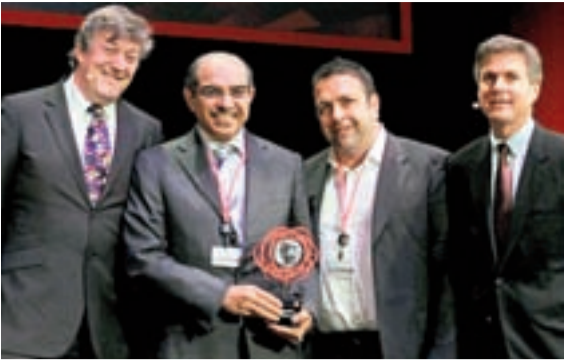
● مندوب الشركة يتسلم الجائزة