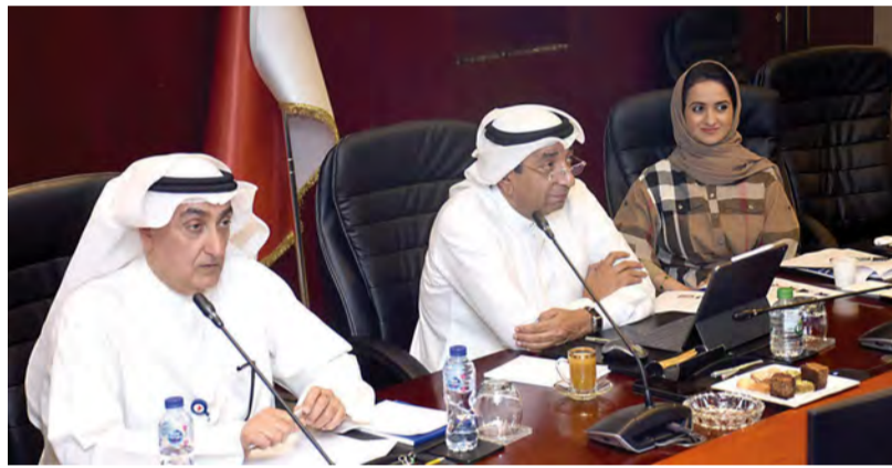
جانب من الجلسة الافتراضية