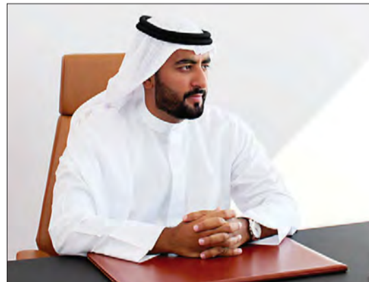
الشيخ نايف بن خالد خليفة

بما يحافظ على زخم الأعمال والحفاظ على الدورة الصحية للعجلة الاقتصادية. وأكد أن تطبيق الجيل الرابع لأنظمة المشتريات بات أولوية قصوى لدى المجلس بغية زيادة الكفاءة وتقديم الخدمات بشفافية ومهنية بما يحقق مستويات عالية من رضا المتعاملين، والاستغلال الأمثل للمال العام وفق أفضل الممارسات ومبادئ الشفافية وتكافؤ الفرص والمساواة وحرية التنافس بين الموردين والمقاولين، الأمر الذي من شأنه أن يضمن تحقيق التميز والتنافسية في جميع ممارسات المناقصات والمشتريات الحكومية. وشدد على أهمية التحول الرقمي في قطاع المشتريات في الإسهام في تعزيز ثقة المستثمرين في اقتصاد المملكة، وجعلها إحدى أبرز الوجهات المستقبلية للأعمال في المنطقة، إذ لطالما كانت مملكة البحرين ولا تزال وجهة تفضيلية لتدفقات رؤوس الأموال الأجنبية المباشرة وغير المباشرة؛ لما توفره من حوافز ومناخ أعمال مرن ومتطور بتشريعاته وقوانينه الحديثة.