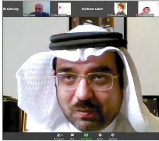
رئيس الجمعية النائب أحمد السلوم