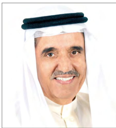
مراد علي مراد

يسر بنك البحرين والكويت (ويحمل رمز التداول BBKB.BH) أن يعلن عن نتائجها المالية لتسعة شهور من عام 2019، حيث تمكن البنك من تحقيق ربح صاف يُنسب لمساهمي البنك بلغ 55.5 مليون دينار بحريني، مقابل 48.4 مليون دينار بحريني في العام السابق أي بزيادة نسبتها 14.6%. كما حقق البنك صافي دخل تشغيلي (بعد خصم المخصصات وباستثناء حصة الأرباح من الشركات الزميلة والمشاريع المشتركة) خلال التسعة شهور من السنة بلغ 49.6 مليون دينار بحريني، مقابل 46.8 مليون دينار بحريني في الفترة نفسها من العام السابق أي بزيادة نسبتها 6%. بالإضافة إلى ارتفاع أرباح البنك من الشركات الزميلة والمشاريع المشتركة لتبلغ 6.4 مليون دينار بحريني لفترة التسعة شهور من السنة مقابل 2.5 مليون دينار بحريني في نهاية الفترة المماثلة في العام السابق مما أدى تحقيق ربح صاف بلغ 56.0 مليون دينار بحريني قبل احتساب الضرائب مقابل 49.3 مليون دينار بحريني في العام السابق. وحقق البنك مجموع دخل تشغيلي بلغ 116.4 مليون دينار بحريني خلال الفترة، مقابل 116.5 مليون دينار بحريني لذات الفترة من العام السابق، وبلغ العائد الأساسي للسهم خلال التسعة شهور من السنة 44 فلساً، مقابل 42 فلساً عن الفترة نفسها من العام السابق.