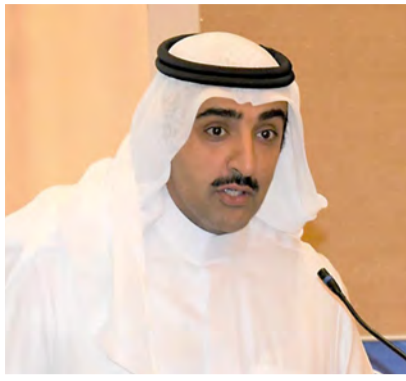
الشيخ محمد بن خليفة

افتتح الشيخ محمد بن خليفة آل خليفة وزير النفط ورشة بعنوان «من التوصيف إلى الإنتاج: فك شفرة مكامن الصخور الكربونية ذات التصنع الطبيعي»، بمشاركة عدد من المتخصصين وكبار الشخصيات والرؤساء التنفيذيين، لمناقشة عدد من المواضيع ذات العلاقة. وينظم هذا الحدث جمعية مهندسي البترول بالتعاون والتنسيق مع الهيئة الوطنية للنفط والغاز، وبدعم من شركة أرامكو السعودية وشركة تطوير للبترول وعدد من الشركات المحلية والإقليمية والعالمية. وتعد هذه الورشة بفندق السوفيتل بالزلاق، وهي تهدف إلى التعرف على أفضل الممارسات لتطبيق تقنيات دقيقة لخزانات كربونات ذات التصنع الطبيعي الذي سيؤدي إلى تطوير الحقل الأمثل.