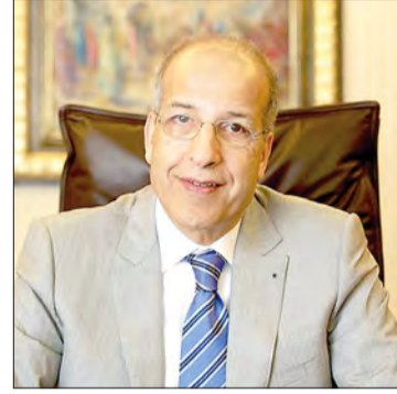
الصديق عمر الكبير

تجدر الإشارة إلى أن بنك البركة الإسلامي هو إحدى الوحدات التابعة لمجموعة البركة المصرفية، وهي مرخصة مصرف جملة إسلامياً من مصرف البحرين المركزي، ومدرجة في بورصتي البحرين وناسداك دبي. وتعد البركة من رواد العمل المصرفي الإسلامي على مستوى العالم، إذ تقدّم خدماتها المصرفية المميزة إلى حوالي مليار شخص في الدول التي تعمل فيها.