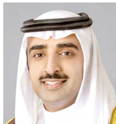
الشيخ محمد بن خليفة

تحت رعاية الشيخ محمد بن خليفة آل خليفة وزير النفط، تستضيف مملكة البحرين لأول مرة فعاليات المؤتمر والمعرض الدولي حول الثورة الصناعية الرابعة تحت شعار «التحولات وقدرات دول مجلس التعاون في مواجهة التغيرات الصناعية»، وذلك خلال الفترة 5 - 7 فبراير من العام المقبل 2019 بفندق الخليج. وينظم هذا الحدث المهم جمعية المهندسين البحرينية بالتعاون والتنسيق مع الهيئة الوطنية للنفط والغاز، وبدعم من عدد من الشركات المحلية والإقليمية والعالمية، وبمشاركة من المهتمين والفنيين والخبراء والمتخصصين وعدد من الجامعات والمعاهد التدريبية المتخصصة في هذا المجال المهم. وقد عبر الشيخ محمد بن خليفة آل خليفة وزير النفط عن سعادته لانعقاد هذا الحدث المهم، ولأول مرة على أرض مملكة البحرين والتي جاءت للسمعة المتميزة التي تحظى بها المملكة في تقديم التسهيلات والدعم والمساندة اللوجستية لانجاح مختلف الفعاليات المتخصصة على أراضيها، منوهاً معاليه بالعلاقات الوطيدة مع جمعية المهندسين البحرينية والدور الكبير التي تقوم بها في تنظيم المؤتمرات والمعارض وورش العمل المتخصصة في القطاع النفطي التي تساهم بذلك في تبادل المعلومات والتجارب والخبرات واستعراض أفضل الممارسات في هذا المجال الحيوي والمهم، متمنياً كل التوفيق والنجاح للمؤتمر وتحقيق ما يصبو إليه من أهداف. وقال الوزير إن العالم