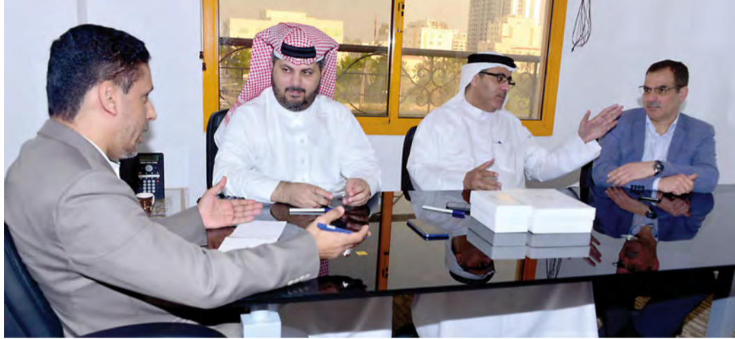
تصوير: نور محمد