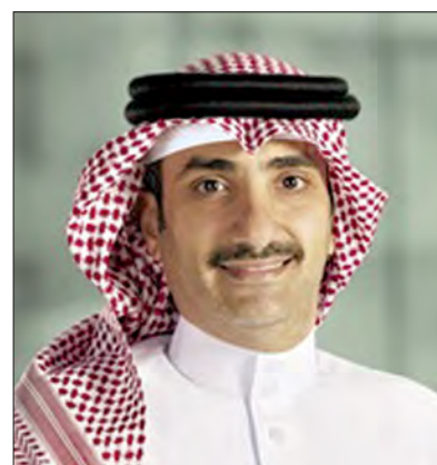
الشيخ عبدالله بن خليفة

كما ارتفع إجمالي الأصول تحت الإدارة لدى سيكو (شاملة التمويلات) بنسبة 9% ليبلغ ما قيمته 1.9 مليار دينار بحريني (4.9 مليار دولار أمريكي) كما في 31 مارس 2022، مقارنة مع 1.7 مليار دينار بحريني (4.5 مليار دولار أمريكي) كما في نهاية عام 2021. بينما ارتفع صافي الأصول تحت الإدارة (باستبعاد التمويلات) بنسبة 8% ليبلغ ما قيمته 1.7 مليار دينار بحريني (4.5 مليار دولار أمريكي) كما في 31 مارس 2022، مقارنة مع 1.5 مليار دينار بحريني (4.1 مليار دولار أمريكي)