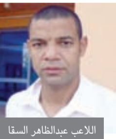
اللاعب عبدالظاهر السقا

للمرة الثانية خلال اسبوع تعرض اللاعب الدولي السابق عبدالظاهر السقا لإطلاق النار، حيث قام متهمون يستقلون دراجة بخارية بإطلاق النار عليه وهو في طريقه لمركز رياضي بالدقي إلا أن الرصاص