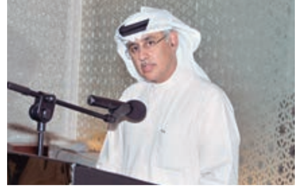
□ وزير الصناعة

قال وزير الصناعة والتجارة زايد راشد الزباني إن المساحة المستأجرة في مدينة التنين الصينية من قبل تجار بحرينيين لم تتجاوز حتى الآن 5% من إجمالي المساحات المتاحة للإيجار في المدينة، وذلك رغم تخصيص البحرينيين بـ 15% من المساحة الإجمالية بأسعار تفضيلية هي 23 ديناراً إيجار المتر الواحد، فيما التجار الصينيون الذين يستأجرون المتر بـ 33 ديناراً أدرجوا أسماءهم على لوائح انتظار في المدينة المتوقع افتتاحها سبتمبر القادم. الزباني، وفي إجابة له على سؤال لـ «الأيام الاقتصادية» حول إمكانية توفير نوع من الحماية للتاجر أو الصناعي أو المقاول البحريني أسوة بدول الخليج العربي الأخرى التي تمنح شركاتها ميزات تفضيلية، أعرب عن رفضه لمبدأ منح الشركات البحرينية نوع من الحماية أو الامتيازات، وقال «نحن ننظر للجدوى الكبرى التي يحققها اقتصادنا الوطني جراء اعتماد مبدأ الاقتصاد الحر، وفتح الاقتصاد يؤدي لزيادة الانتاجية، وتحفيز البحريني ليزيد من كفاءته ويعمل وفق معايير عالمية».