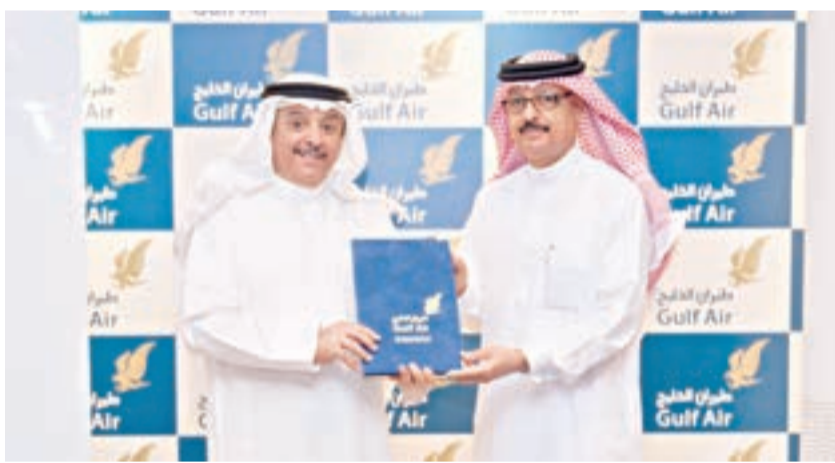
خلال تبادل الاتفاقيات

وأضاف تسعي الحملة الجديدة إلى الاحتفال إلى «ما لا نهاية» ما يسלט الضوء على روزنامة ماليزيا التي تزخر طوال أيام السنة بالاحتفالات والمهرجانات على أنواعها، بما في ذلك على سبيل المثال لا الحصر المهرجانات الثقافية، وفعاليات التسوق الفاخرة، والفعاليات الدولية، والفعاليات البيئية السياحية، والفنون، والموسيقى، والفعاليات الخاصة بالطعام والمأكولات، وغيرها الكثير. وأكد نورالدين أنه دعماً للجهود والزمخ المرافق لحملة «عام زيارة ماليزيا» في العام 2014، يهدف مهرجان 2015MyFest إلى الحفاظ على المرتبة الأولى التي تحتلها ماليزيا بصفتها الوجهة الرئيسية التي يقصدها