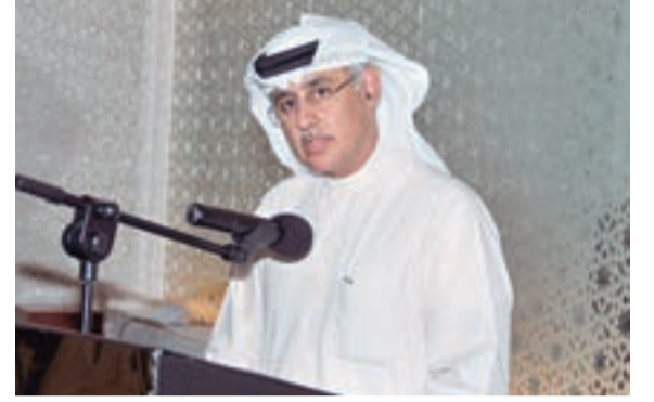
□ وزير الصناعة

قال وزير الصناعة والتجارة زايد راشد الزباني إن المساحة المستأجرة في مدينة التنين الصينية من قبل تجار بحرينيين لم تتجاوز حتى الآن 5% من إجمالي المساحات المتاحة للإيجار في المدينة، وذلك رغم تخصيص البحرينيين بـ 15% من المساحة الإجمالية بأسعار تفضيلية هي 23 ديناراً إيجار المتر الواحد، فيما التجار الصينيون الذين يستأجرون المتر بـ 33 ديناراً أدرجوا أسماءهم على لوائح انتظار في المدينة المتوقع افتتاحها سبتمبر القادم. الزباني، وفي إجابة له على سؤال لـ «الأيام الاقتصادية» حول إمكانية توفير نوع من الحماية للتاجر أو الصناعي أو المقاول البحريني أسوة بدول الخليج العربي الأخرى التي تمنح شركاتها ميزات تفضيلية، أعرب عن رفضه لمبدأ منح الشركات البحرينية نوع من الحماية أو الامتيازات، وقال «نحن ننظر للجدوى الكبرى التي يحققها اقتصادنا الوطني جراء اعتماد مبدأ الاقتصاد الحر، وفتح الاقتصاد يؤدي لزيادة الانتاجية، وتحفيز البحريني ليزيد من كفاءته ويعمل وفق معايير عالمية».