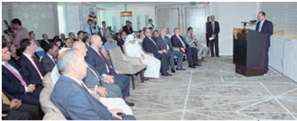
□ تصوير: نور محمد