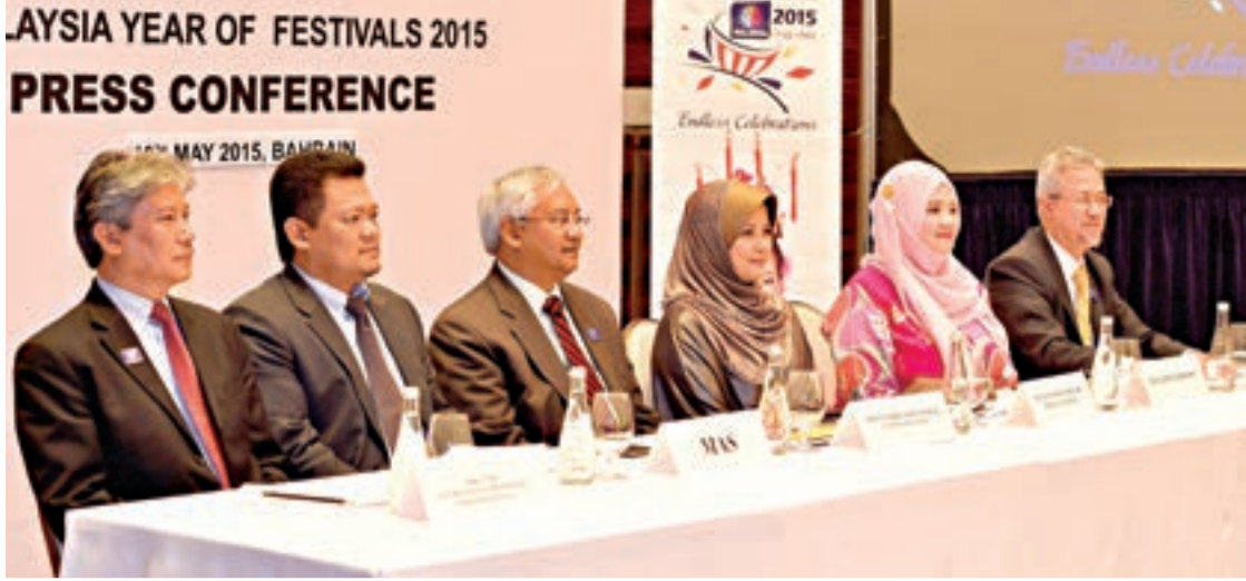
وفد هيئة السياحة الماليزية خلال المؤتمر الصحفي