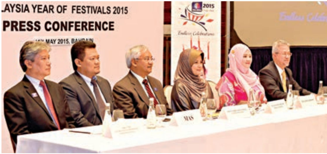
وفد هيئة السياحة الماليزية خلال المؤتمر الصحفي