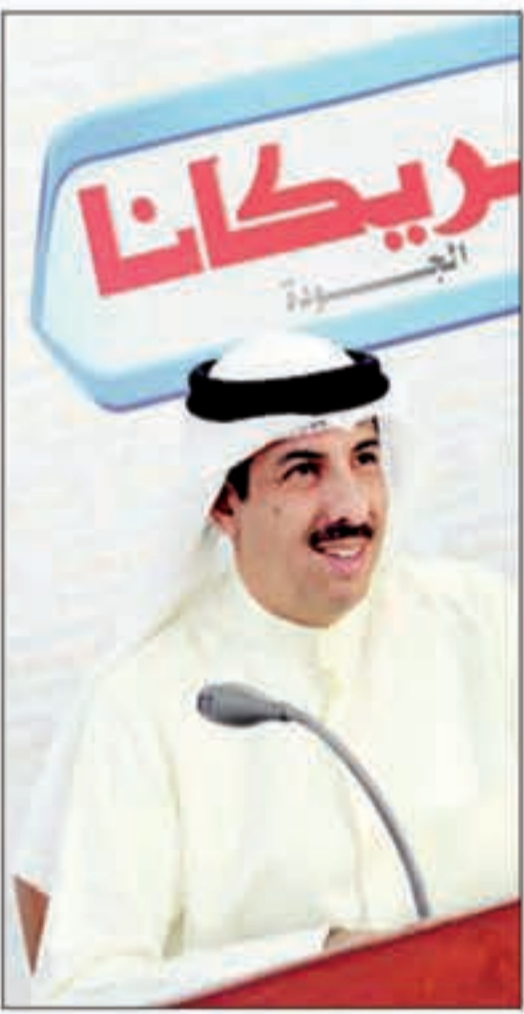
رئيساً للجمعية العمومية

أكثر من 25 دولة حول العالم من بينها 17 دولة عربية بجانب أميركا وكندا وبعض الدول الأوروبية. وقدم قطاع التصنيع العديد من منتجاته المصنوعة منها «حليمة الدجاج الحارة المقرمشة» و«حلق الكالاماري» و«اصابع السلطعون» و«كوكيتل ثمار البحر» و«ترايح اللحم البقري المشوي» والروبيان المشوي مع البطيخ من خلال قطاع اللحوم. وقدم قطاع المنتجات المعلبة (كالبفورتيا جازرن) منتجاته الجديدة من الفول المثلج بالسمسم، ومنتجات التونة المشوية الجوزية البيضاء، والجولد المتكاسمة، والجولد الماكور البيضاء، وطرح قطاع الكيك مجموعة جديدة من المنتجات خلال عام 2014 منها كيك براون في الشوكولاتة، والكيك كيك لسانة، والمحمشو بمثلجات مختلفة، وكوكيتل الشوفان.