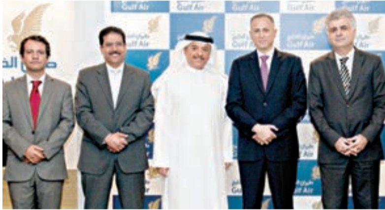
مسؤولو طيران الخليج وشركة «اتش بي»