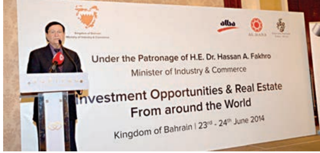
الوزير يلقي كلمته في المؤتمر

وفي هذا السياق أشاد الوزير بما اشتمل عليه برنامج الفعالية والذي اشتمل على التعريف بمملكة البحرين، وعرض فرص التواصل وما يمكن ان تقدمه البحرين للمستثمرين الأجانب في قطاع التجارة والصناعة وليس فقط في قطاع العقارات فحسب. مشيراً إلى مقترح المدينة الجديدة للمعارض والمدينة الاقتصادية والصناعية الجديدة كنموذج للتنمية الاقتصادية في مملكة البحرين.