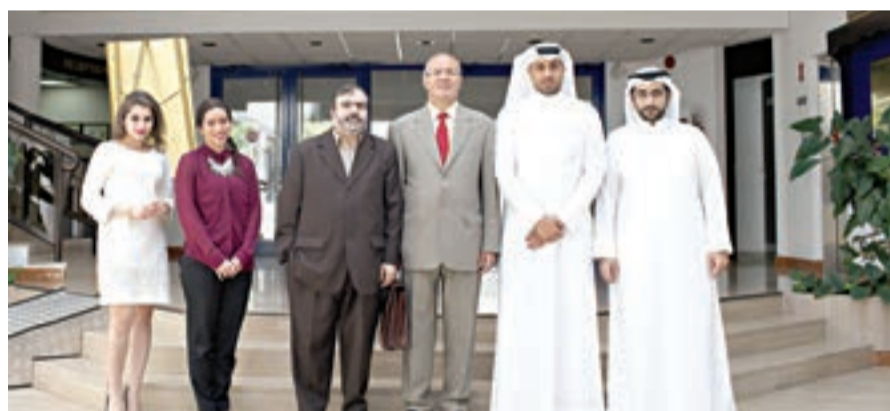
مقدمو الدورة مع بعض المشاركين فيها

في الأقسام القانونية في البنوك الإسلامية والعامون في مختلف الصناديق الاستثمارية والمحامون والخبراء وطلاب القانون والمالية، بالإضافة إلى أعضاء مجالس الرقابة الشرعية والتدقيق الشرعي.