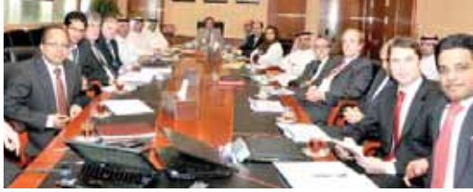
مجموعة من أصحاب الأعمال في اجتماعهم مع أمم بيت التجار

د. فخره يتأسس الاجتماع الثالث للمدينة الاقتصادية