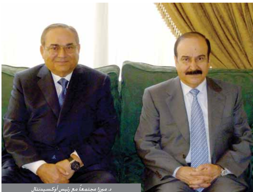
د. ميرزا مجتمعا مع رئيس أوكسيدنتال