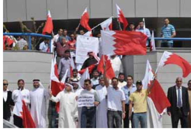
كتب - نضال الشيخ:

وبدأ الاجتماع بترحيب الوزير بأعضاء اللجنة والإشادة بجهودهم وتعاونهم مع الوزارة في موضوع المدينة الصناعية الجديدة. وبعدها قام ممثلو شركة آرثر دي ليتل بتقديم عرض يركز على مضمون المدينة الاقتصادية الجديدة وتأثيراتها الاقتصادية على ملكة البحرين تماشياً مع رؤية 2030. كما تم التطرق إلى استعراض استراتيجيات التطوير ومناقشة المواقع المحتملة لإقامة هذا المشروع الضخم. إذ من المفترض أن تكون المدينة الاقتصادية الجديدة بيئة خصبة تحتوي على نية ختية متطورة جداً قادرة على استقطاب رؤوس الأموال الأجنبية والاستثمارات في مجالات التصنيع الراقى والخدمات. وفي هذا الصدد أبدى الوزير اهتمامه بما سيوفره هذا المشروع من فرص عمل ذات قيمة مضافة وفرص تحسين للمداخيل مستقبلاً كما أشاد باهتمام جميع الجهات المعنية بهذا المشروع الهام الذي سيسهم في دفع عجلة