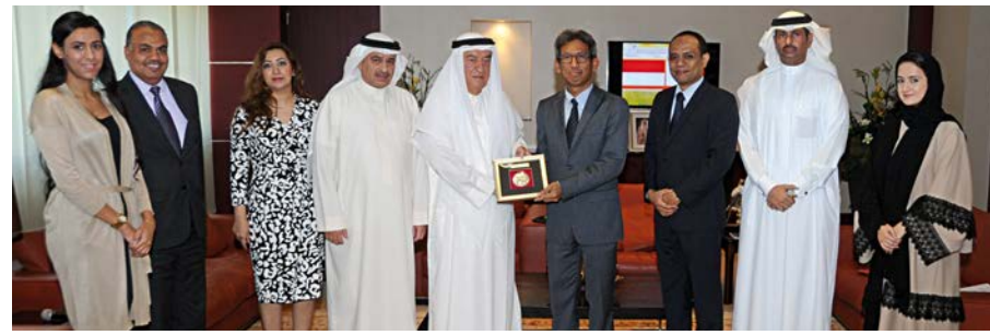
وفد الغرفة يلتقي السفير الاندونيسي

كما أكد على اهتمام الغرفة بالاتقاء بمستوى العلاقات الثنائية بين البلدين من خلال تفعيل دور القطاع الخاص في البلدين لتنمية وتنشيط الاستثمارات المشتركة، مشيراً إلى أهمية تدليل كافة المعوقات التي تعترض النهوض بالتبادل التجاري البحريني الاندونيسي، منها تسهيل الاستيراد المباشر من اندونيسيا إلى البحرين دون الحاجة لعبور المنتجات والسلع من الدول الأخرى وصولاً للمملكة.