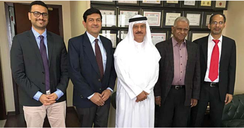
الوفد الهندي لدى زيارته اتحاد الغرف الخليجية