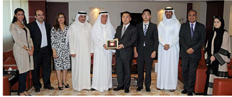
وفد الغرفة خلال زيارته للسفير الكوري

الاقتصادية البحرينية الكورية، ودعم التعاون بين البلدين الصديقين. مؤكداً على أهمية تبادل الزيارات بين الوفود التجارية خاصة القطاعية المتخصصة، ومبدياً استعداد السفارة الكورية في البحرين للتنسيق مع الغرفة في كل ما يسهم بتنمية علاقات الشراكة بين الجانبين، كما أشاد بالزيارة الأخيرة للجنة تجار البحرين الآسيويين إلى السفارة الكورية والتي ساهمت بالتعرف على الفرص الاستثمارية المتاحة وجذب المستثمرين الكوريين للقدوم إلى البحرين والاستثمار فيها. ولفت إلى أن الجانب الكوري يعتزم قريباً تنظيم فعالية اقتصادية للتعريف بالمشاريع الاستثمارية المتاحة في كوريا والبحرين ودول الخليج كافة، تمهيداً لإقامة مشاريع اقتصادية وتوطيد العلاقات الثنائية بين أصحاب الأعمال في البلدين الصديقين والاستفادة من تبادل الخبرات.